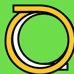
Caños de agua