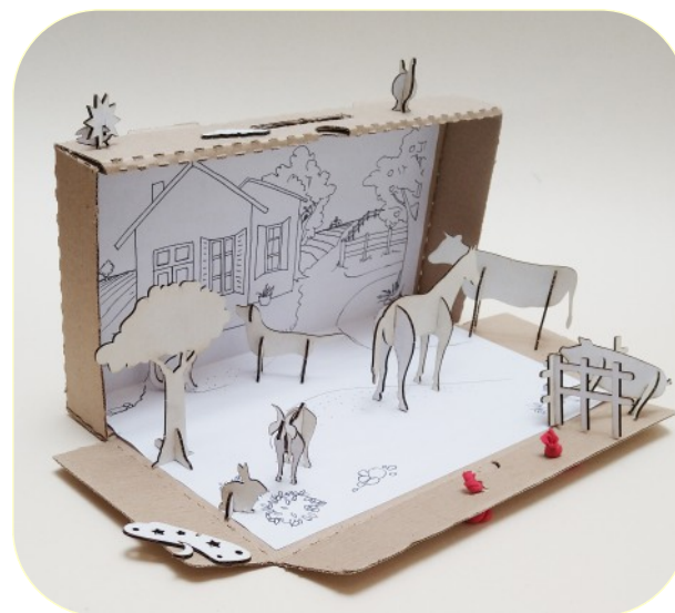
Granja y Hogar